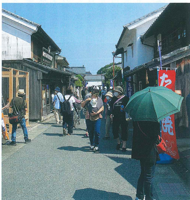
「浜崎伝建おたから博物館」に出店